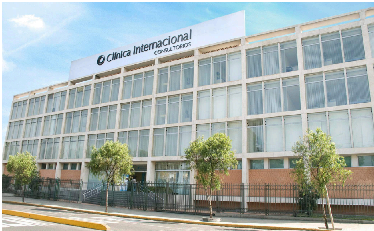
Clínica Internacional sede Lima, Perú, foto cortesía www.clinica-internacional.com.pe

HDQ hace un reconocimiento especial a nuestro cliente GRUPO CLÍNICA INTERNACIONAL en Perú por la reacreditación con Joint Commission International (JCI) de sus sedes de Lima y San Borja.