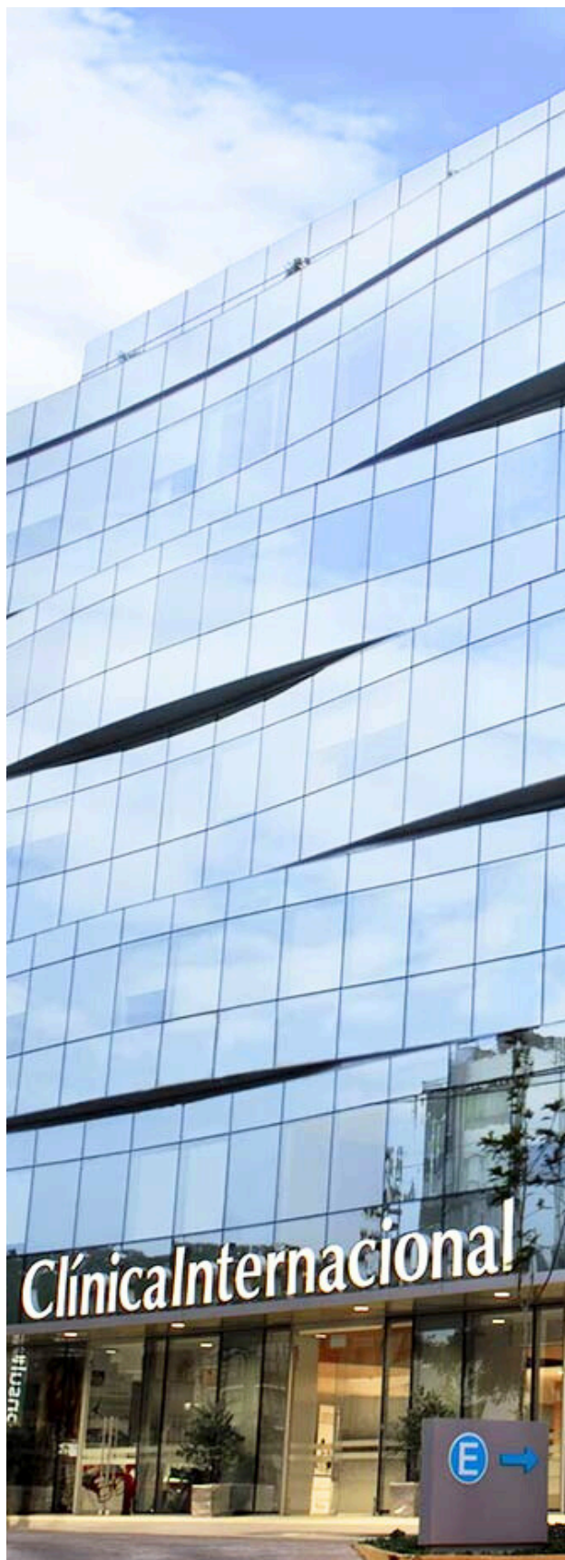
Clínica Internacional sede San Borja, Perú

Para acceder a más información, les invitamos a visitar la página www.clinicainternacional.com.pe y la página de www.jointcommissioninternational.org .